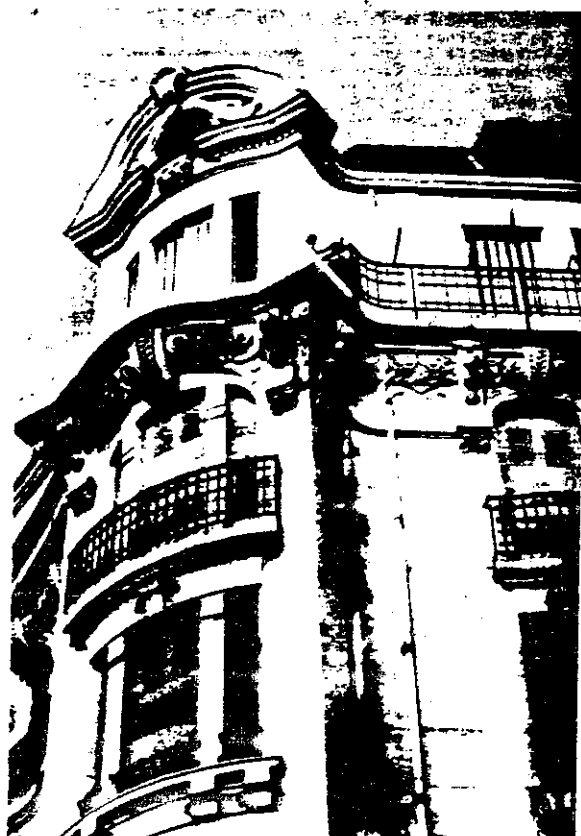
Une muraille extérieure comme une large vague