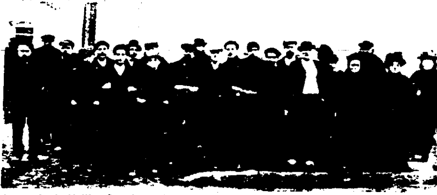
La sortie de Vuillot-Ancel en 1908

La République méritait bien un cours... Villeurbanne le lui a donné... Alléluia! Mais il aura fallu attendre pour cela l'an 1870 et la République Troisième du nom. Jusque là, cette avenue, ponctuée désormais par le « Totem » d'un côté et un rond point fleuri de l'autre, portait le nom de Napoléon. Une voie qui fut donc impériale avant de devenir républicaine. Une destinée entièrement liée à l'histoire de toutes façons.